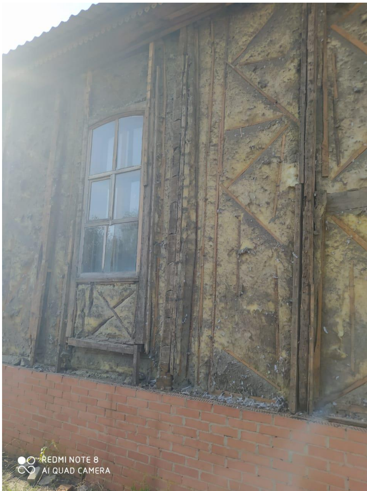
Демонтаж обшивки стен